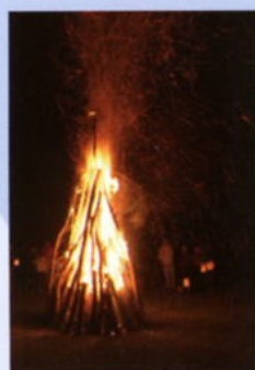
Feu de la St Jean 20 juin