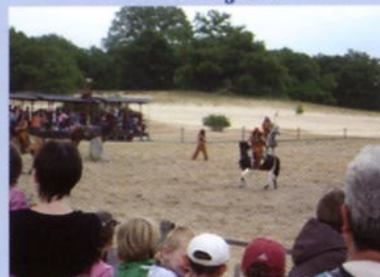
Sortie Mer de sable Ecole 18 juin