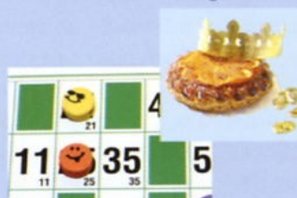
Soirée Loto et Galette des Rois Ecole 30 janvier