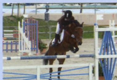
Participation Championnats de France - Epinette 18-26 juillet