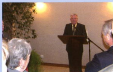
Vœux du Maire 23 janvier