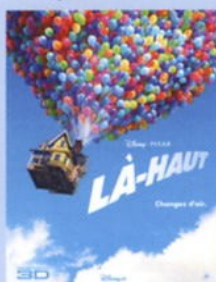
Sortie Cinéma juillet