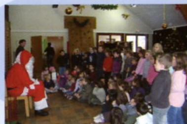
Noël Ecole 18 décembre