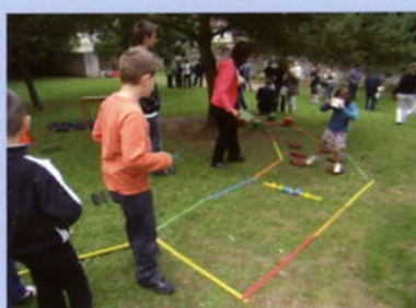
Fête de l'Ecole 20 juin