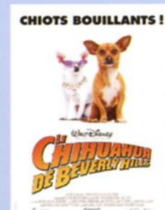
Sortie Cinéma juin