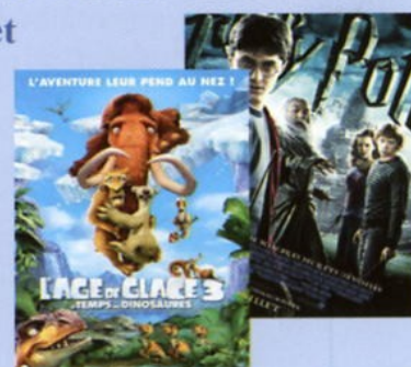
Sorties Cinéma août