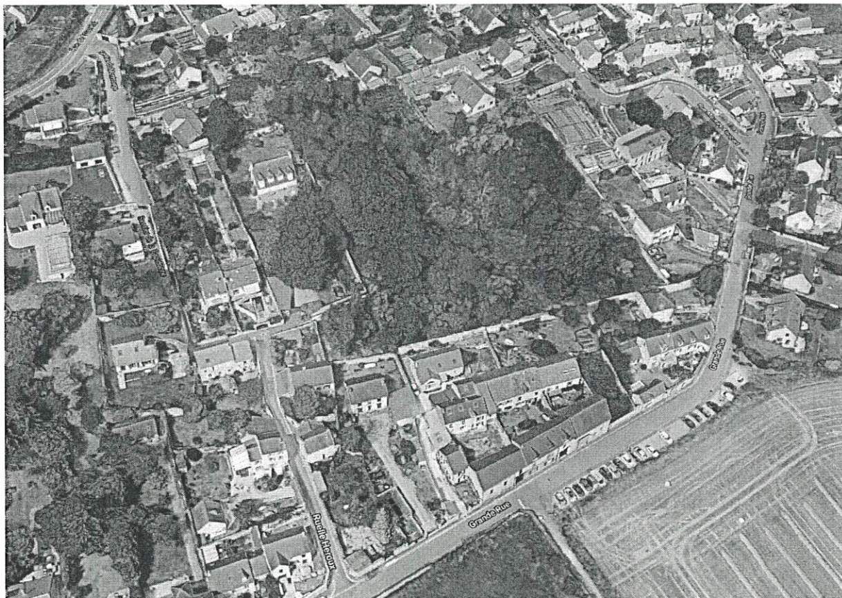
Vue aérienne sur l'îlot et le cœur d'îlot boisé dit « La Cupidone »

La Commune souhaite engager une concertation visant à recueillir les attentes des habitants riverains ou non de ce site.